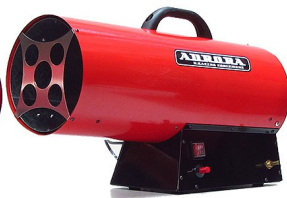
GAS HEAT 30