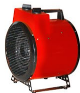
HEAT PLUS 200 MINI