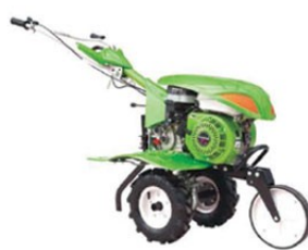
GARDENER 750 SMART