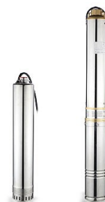
ADP 900H ADP 1100