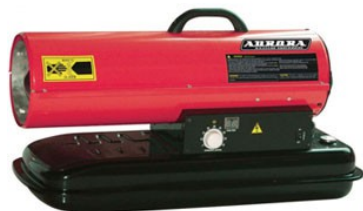
DIESEL HEAT 15