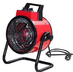
HEAT PLUS 2000 / 3000