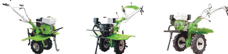
COUNTRY 800 HD