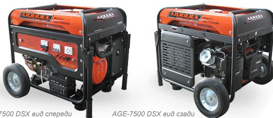
AGE-7500 DSX вид спереди