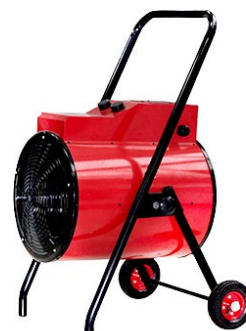
HEAT PLUS 15000 / 30000