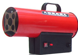
GAS HEAT 15