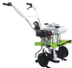
GARDENER 550 MINI