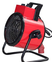
HEAT PLUS 5000 / 9000