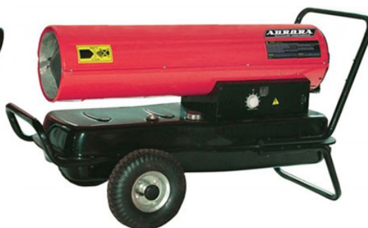
DIESEL HEAT 60