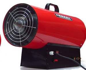
GAS HEAT 50