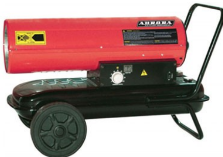
DIESEL HEAT 30