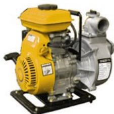
AMP 50C LIGHT